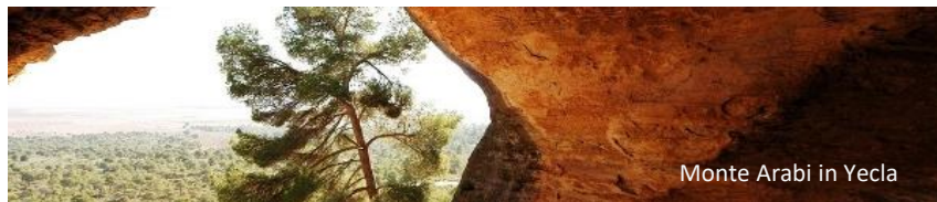
Monte Arabi in Yecla

Monastrell, Syrah, Merlot und Tempranillo Cassis, Brombeere, Nelken, Minze, Veilchen erdige- und mineralischen Noten