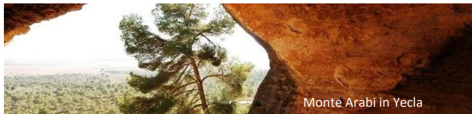
Monte Arabi in Yecla